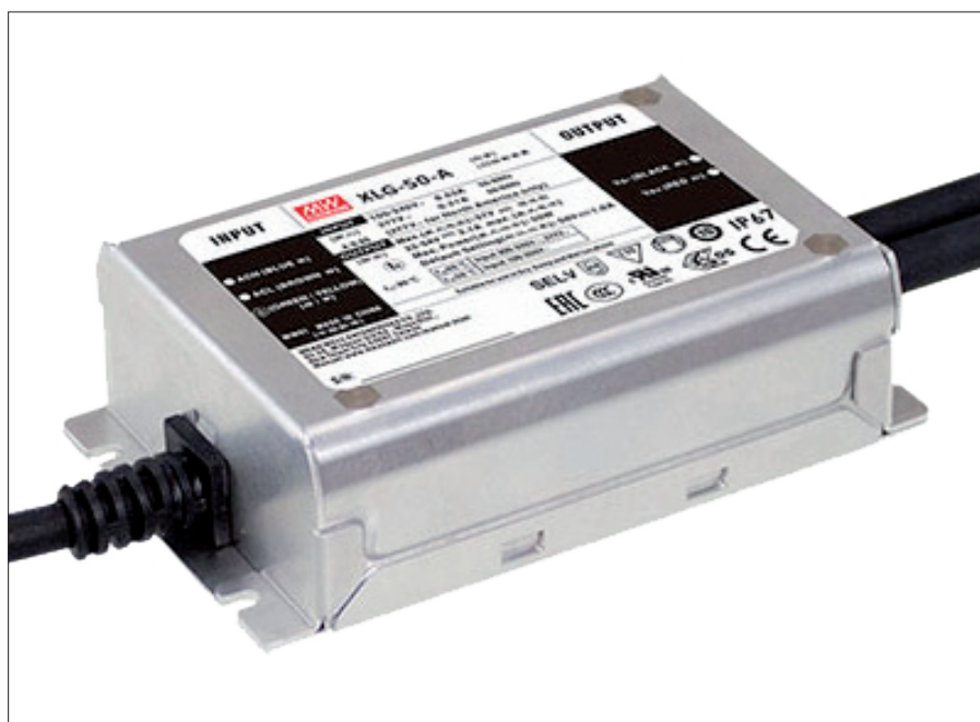
Obr. 1. Napájecí zdroj XLG-50-AB s konstantním výkonem

Při napájení LED pásku s rezistory zdrojem CV nebo CP na první pohled není rozdíl zřejmý. Projeví se v okamžiku zapnutí svítidla, během stmívání nebo při změnách pracovních teplot. Tehdy