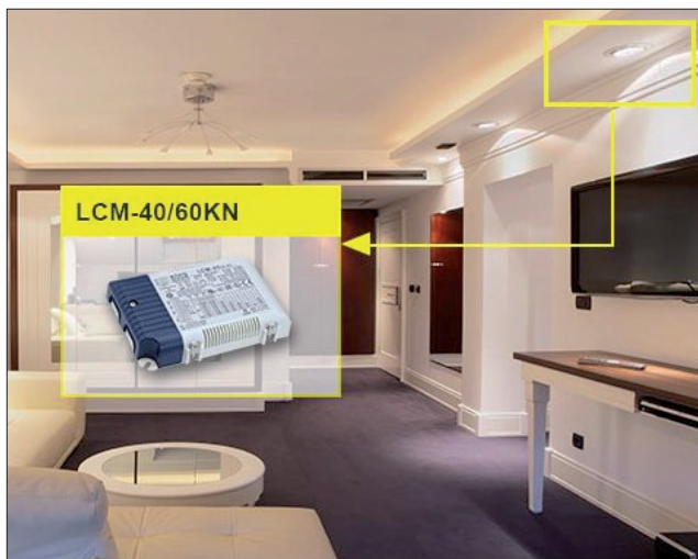
Obr. 2. Příklad použití LCM KNX zdroje

vodičem ke zdroji). Čítač provozních hodin uvnitř zdrojů LCM-KN lze využít ke zjištění aktivní doby provozu, popř. zdroj