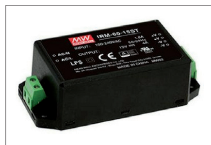
Obr. 3. IRM v provedení se šroubovými svorkami

Zdroje IRM jsou certifikovány jako LPS, tj. napájecí prvky s malým výkonem. To může být vhodné tam, kde je projektant nu-