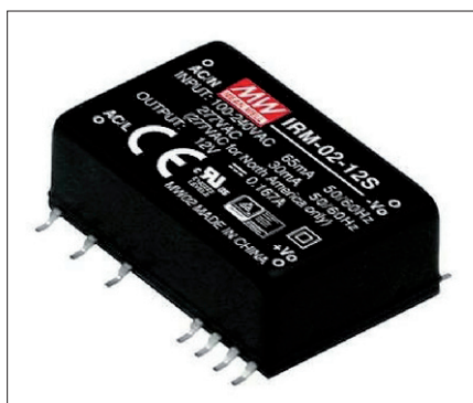
Obr. 2. IRM v provedení pro povrchovou montáž

Jak je u MEAN WELL zvykem, obsahuje IRM zdroje inteligentní ochrany před poruchami nebo chybě při montáži, konkrétně jsou zabudovány prvky ochraňující zdroj před zkratem, nadměrným odběrem nebo vnikem vnějšího napětí na výstupní svorky. Posledně jmenovaná ochrana zaručí souběžně i nemožnost přepětí na zátěži, i když je zdroj neaktivní nebo ve stavu poruchy.