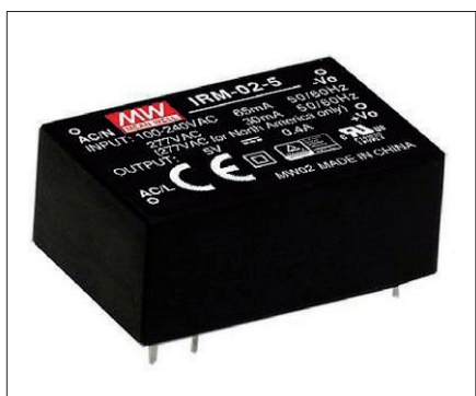
Obr. 1. IRM spínaný zdroj s vývody do DPS

Kompaktní rozměrové úsporné zdroje řady IRM renomovaný výrobce MEAN WELL vyvinul pro průmyslová elektrická zařízení, automatizaci výrobních postupů, příruční elektronická zařízení nebo obecně do aplikací s požadavkem na montáž přímo na desku s plošnými spoji.