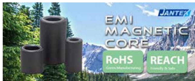
Nová séria odrušovacích feritových jadierok

Aby sa uspokojil rastúci dopyt po účinných riešeniach potlačenia elektromagnetického rušenia na trhu, spoločnosť PowerNex predstavila tri široko používané modely magnetických jadier EMI vrátane RH105055200, RH140090150 a RH175095285.