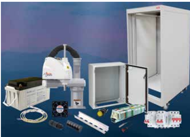
Sortiment produktov PowerNex

V súčasnosti je od výrobcu PowerNex Precision Technology k dispozícii široký sortiment výrobkov, ktorý sa neustále rozširuje podľa požiadaviek trhu. Ide o komplexnú platformu pre komponenty napájacích zdrojov, ktorá integruje globálny dodávateľský reťazec a celosvetových distribútorov. PowerNex Precision Technology konsoliduje viac ako 10 000 štandardných modelov MEAN WELL. Globálny logistický systém spoločnosti spolupracuje s partnermi v dodávateľskom reťazci prostredníctvom 245 autorizovaných distribútorov s cieľom uspokojiť dopyt zákazníkov po komponentoch napájacích zdrojov a ich aplikáciách.